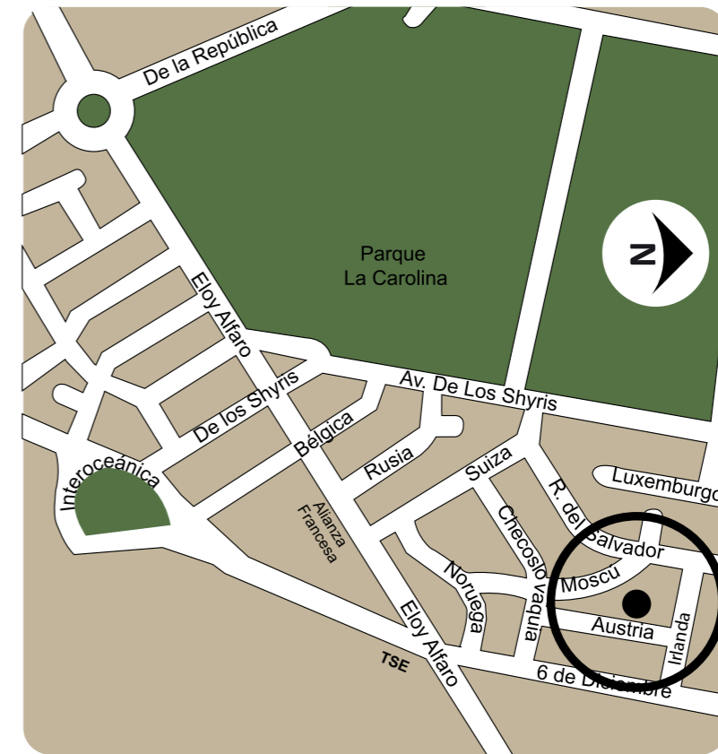
Austria e Irlanda

La República del Salvador en el centro norte de la ciudad, se construye hoy en día como el espacio arquitectónico de vanguardia, es la zona residencial más cotizada de Quito.